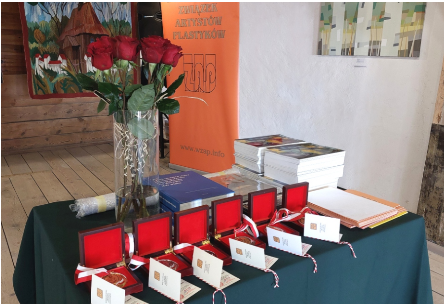
Migawka z wernisażu.