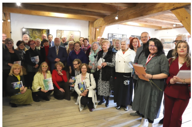
Artyści, uczestnicy XI wystawy „Zderzenia” w zabytkowym spichlerzu Muzeum Narodowego Rolnictwa w Szreniawie