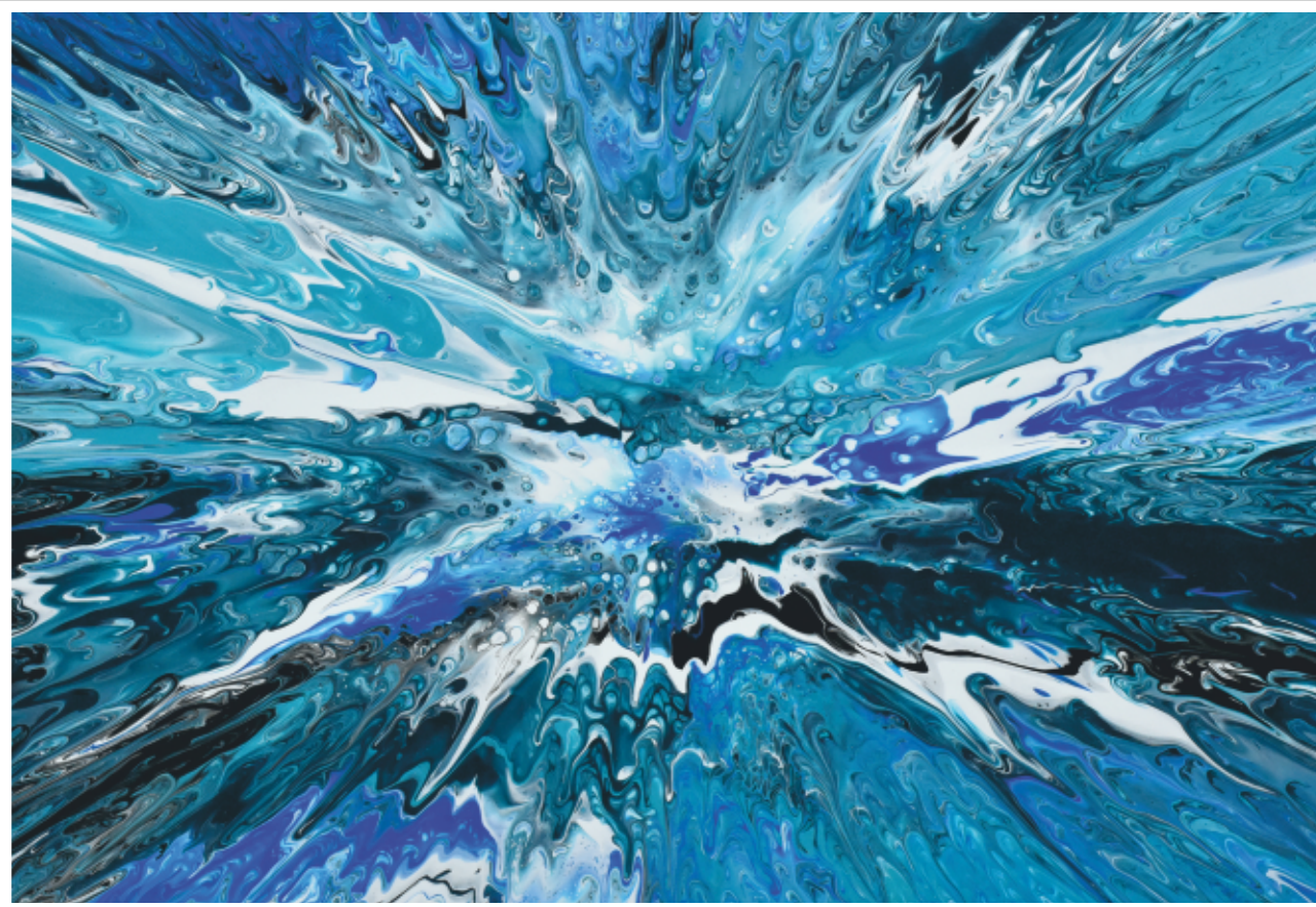
ANTONI RUT „Kobieta jest jak ... przestrzeń”, akryl na płótnie 70 x 100 cm.